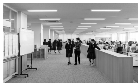
職員室 [自由に出入り出来ます。扉はありません]