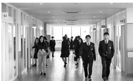
廊下 [幅5.0m] 出会いのスペース