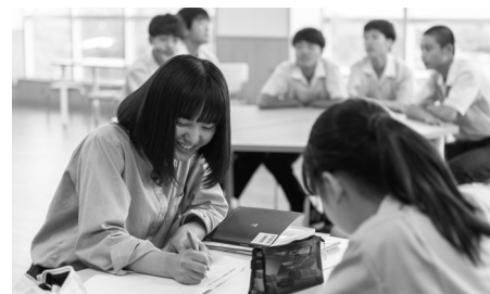
オープンスペース(3F・4F) [2教室分の広さ]

「建学の精神『実学の体得』社会に貢献する人を育てる」/「平和・ひと・環境を大切にする学び舎」